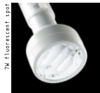
7W fluorescent spot