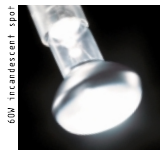
60W incandescent spot